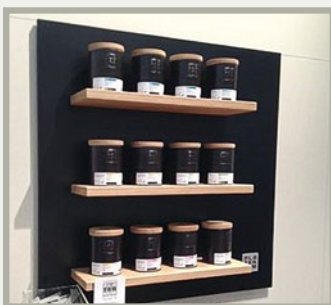
Abb.: Wanddisplay mit 3 Eichenholzregalen