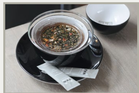
Abb.: Teeschale, Art.Nr. 6742; Untertasse, Art.Nr. 6743; Schale, Art.Nr. 6744; Glassieb, Art.Nr. 6613; Weisser Kandis, Art.Nr. 5450