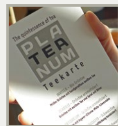
Abb.: Teekarte, Art.Nr. 6748