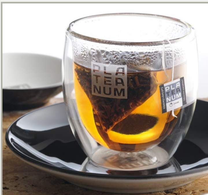
Abb.: Doppelwandglas, Art.Nr. 6746; Ablageschale, Art.Nr. 6799; Untertasse, Art.Nr. 6743