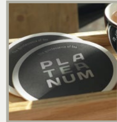
Abb.: Untersetzer, Art.Nr. 6749