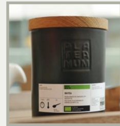
Abb.: Steinzeugdose, Art.Nr. 6752