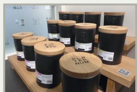
Abb.: Treppendisplay aus Eichenholz