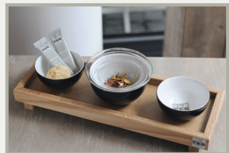
Abb.: Holzmodul, Art.Nr. 6747